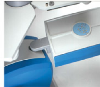
Consolle con pannello comandi e Cassetto porta lenti