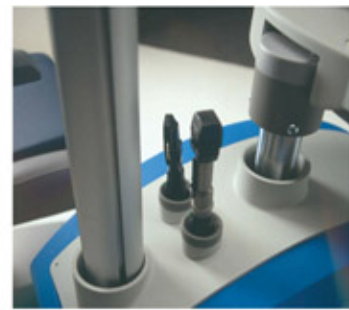
Alloggio strumenti a mano