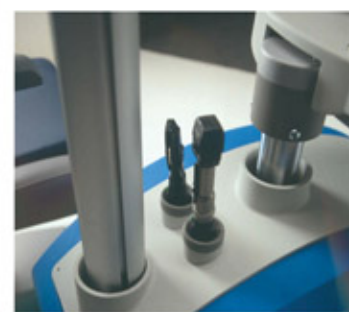
Alloggio strumenti a mano